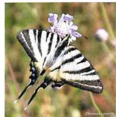
Flambé ( Iphiclidés podalirius )

Chez les insectes, on compte aujourd'hui 3 espèces protégées au niveau régional par l'Arrêté du 22 juillet 1993 (liste des insectes protégés en région Ile-de-France pour compléter la liste nationale. Il s'agit d'un