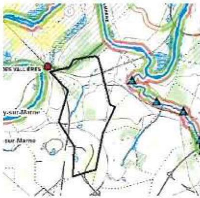
Extrait de la carte assemblée des objectifs du SRCE

« La commune de Coupvray et le site d'étude se trouve en limite sud d'un vaste territoire considéré comme « Réservoir de Biodiversité ». 1