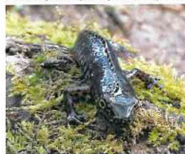
Espèce présente sur la commune et potentiellement sur le site