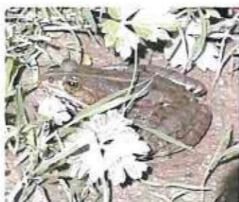
Grenouille agile ( Rana dalmatia )

papillon de jour, le Flambé ( Iphiclides podalirius ), d'une demoiselle (famille des libellule) Agrion nain ( Ischnura pumilio ) ; et du Grillon d'Italie ( Oecanthus pellucens )