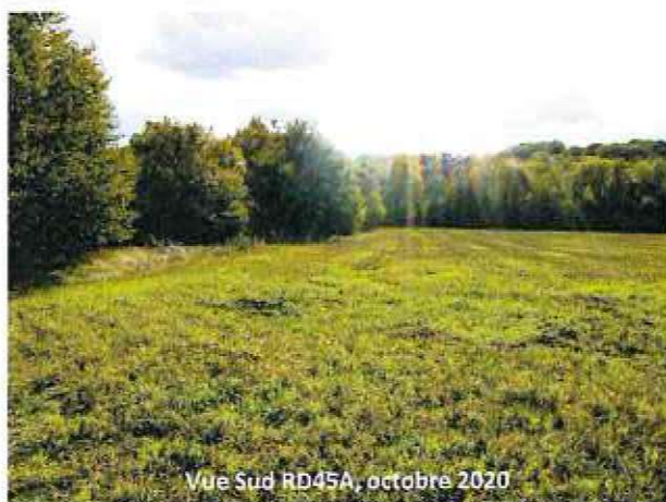
Vue Sud RD45A, octobre 2020